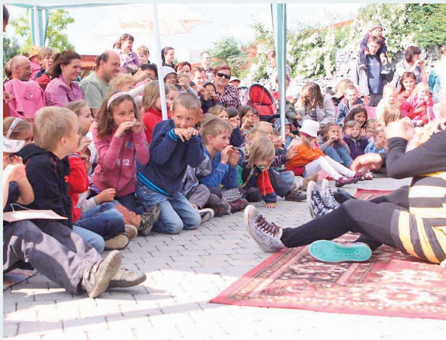
Akce v čerčanském hospici.