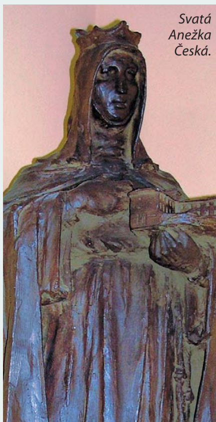
Svatá Anežka Česká.