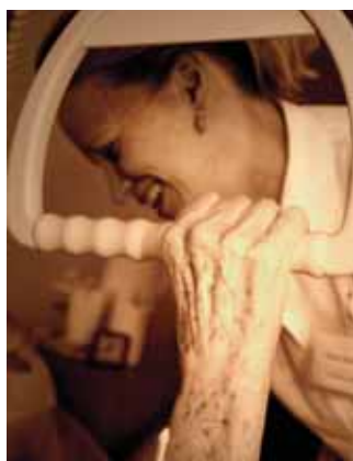
Foto z výstavy Nevšední tvář radosti. Autoři H. Bártíková a L. Ton

Jako zástupci většiny poskytovatelů hospicové paliativní péče v ČR vítáme shodu zdravotnických expertů koaličních stran v oblasti rozvoje paliativní a hospicové péče v ČR. Velmi si