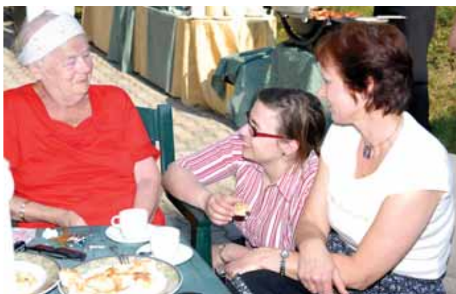
Partnerské setkání v pražském Hospici Štrasburk

■ Exkurze, přednáška a koncert Podblanického smíšeného sboru